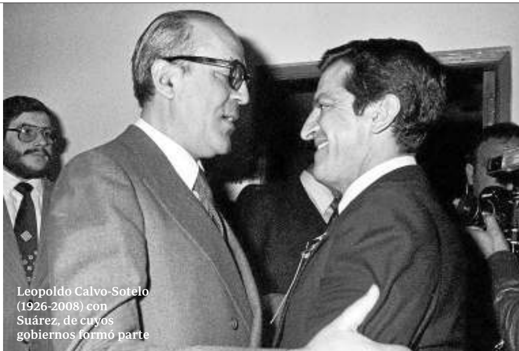
Leopoldo Calvo-Sotelo (1926-2008) con Suárez, de cuyos gobiernos formó parte

En febrero de 1978 fue designado ministro para las relaciones con las Comunidades Europeas. Después de una breve etapa como ministro de Economía y vicepresidente segundo del Gobierno, fue nombrado en febrero de 1981, como consecuencia de la dimisión de Suárez y después del intento