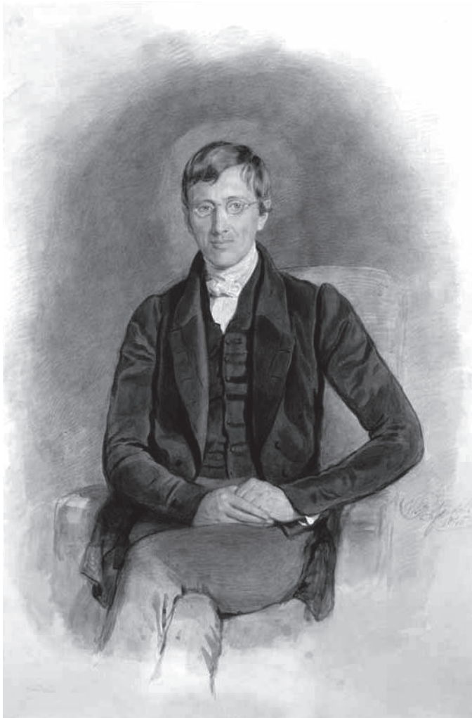
Retrato de John Henry Newman pintado por Sir William Charles Ross en el año de su conversión, 1845.